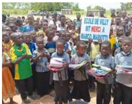
Consegna materiale scolastico a Villy.