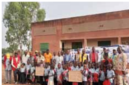
Bambini a scuola nel villaggio di Kindi.

Diversi club si stanno impegnando per questo service che, dopo tre anni, si cercherà di focalizzare maggiormente verso i bambini che, senza aiuti, non potrebbero frequentare la scuola. ASDE si farà carico di rilevare questi bisogni e di verificare nel tempo l'effetto positivo del sostegno di MK sull'abbandono scolastico. Sarà valutata anche l'eventuale prosecuzione del sostegno ad alcuni ragazzi/e, indigenti ma meritevoli, per l'iscrizione alle scuole di secondo livello.