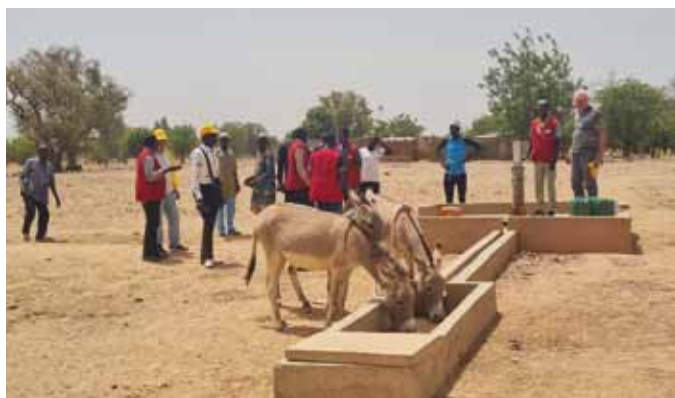
Adesso c'è l'acqua anche per gli asini.