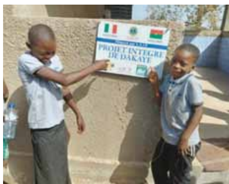
Il sorriso dei bambini di Dakaye che hanno ricevuto scuola nuova, pozzo ed orto verde.