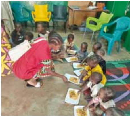
Bambini all'orfanatrofio di Anadji.

Grazie alla collaborazione di ASDE da quest'anno, nell'occasione della consegna dei viveri agli orfanotrofi, si sono avviate le valutazioni sulle singole necessità per mirare meglio le forniture (latte in polvere piuttosto che altri tipi di alimenti). Le somme raccolte nel 2023 hanno consentito di sostenere gli orfanotrofi di Les Saints Innocents di Guiloungou, Home Kisito di Ouagadougou, Wend-Mib-Tiiri di Yako, Hotel Maternel di Ouagadougou, La Pouponniere Anadji, Wend-N-Goudi, Villy, Reo di Koudougou. Il momento della consegna di 800-1.000 € di viveri è sempre una festa per i bambini.