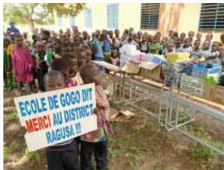
Bambini della scuola di Gogo.