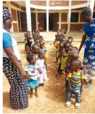
Bambini in fila per un test.

MK ha partecipato col Distretto 403 A3 (Burkina Faso) al service internazionale per la prevenzione del cancro infantile co-finanziando gli screening. MK ha partecipato con entusiasmo a questa campagna nella consapevolezza che i bambini affetti da cancro in Burkina, come in tutti i paesi a basso reddito, hanno un terzo delle probabilità di guarire rispetto ai bambini occidentali, in quanto la malattia viene diagnosticata in ritardo e vengono di conseguenza affidati alle cure mediche quando è già in fase avanzata.