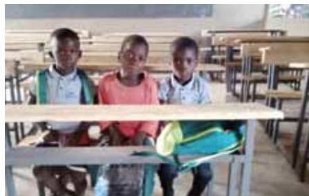
Une vue des tables-banc.