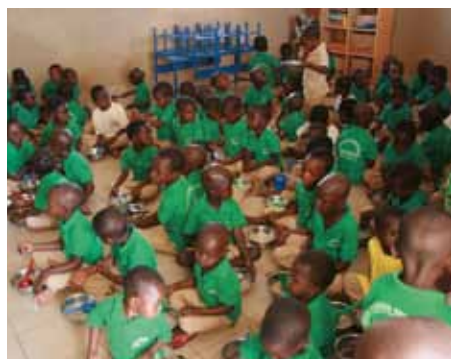
Centre Avenir 1.