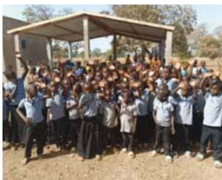
100% a scuola – Con la scuola più grande, tutti i bambini del villaggio potranno frequentare le elementari.

La formazione per contrastare la marginalità sociale