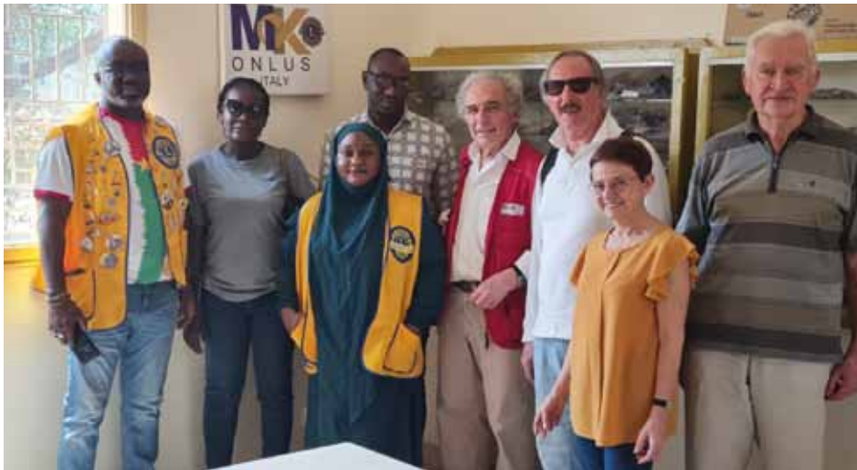
I Lions locali con la delegazione 2024 di MK Onlus nel nuovo centro di distribuzione degli occhiali.

Nel 2023, alla presenza delle autorità lionistiche locali, del Presidente della Onlus Occhiali Usati e dei rappresentanti MK Onlus, è stato aperto a Ouagadougou un centro per la distribuzione degli Occhiali usati per tutto il Burkina Faso. La Onlus Occhiali Usati ha spedito una prima trince di 10.000 occhiali che sono stati catalogati, sistemati nel locale messo a disposizione e che verranno spediti ai vari centri del territorio che li distribuiranno a seguito di visite oculistiche. La gestione del magazzino è affidata a giovani Leo Burkinabè col supporto e la supervisione dei Lions della capitale.