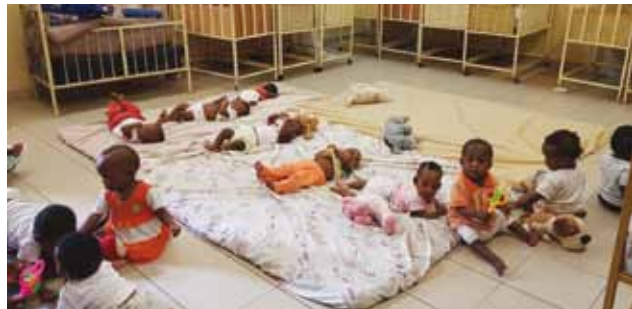
Orfanatrofio Hotel Maternel.

Questo service, che accompagna MK dalla nascita, continua ad avere un grande appoggio da parte di molti Lions, privati e da club. Il problema degli orfani rimane molto attuale, purtroppo, sia per i tanti nuovi ingressi nelle strutture che per la difficoltà, specie in orfanotrofi più lontani dalle città, di riuscire a trovare delle famiglie adottanti. In conseguenza di ciò alcuni ragazzi rimangono ospiti anche in età non più giovanile e si avviano quindi alle attività lavorative.