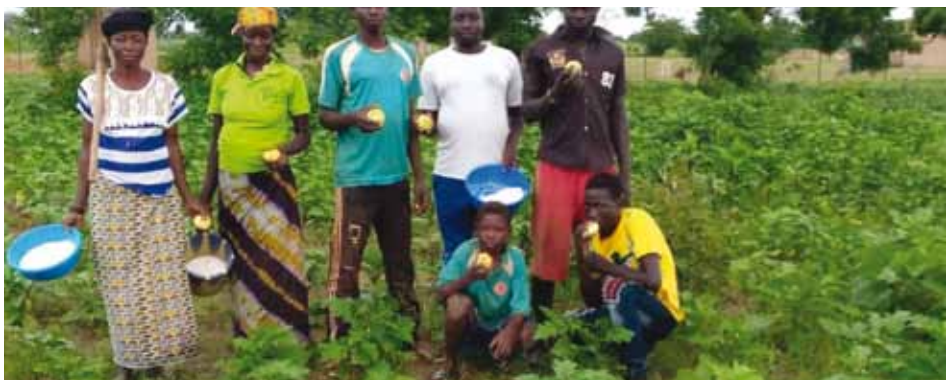
I villaggi hanno seminato superfici maggiori, quindi c'è cibo per la famiglia e prodotto da vendere.

PRESTITO UMANITARIO = costituito un “Fondo di rotazione” per il sostegno allo sviluppo delle produzioni rurali per l’acquisto di sementi. Con 600 € di sementi ogni villaggio riesce ad attivare un’orto più grande.