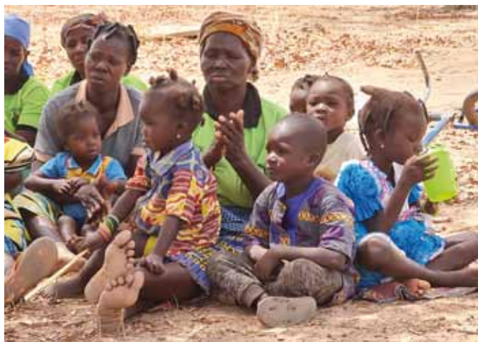
Le donne del villaggio sono mamme e socie della cooperativa femminile.

È il programma appena completato a Lounga (Imasgo) dove già sono state ufficializzate due cooperative che si impegneranno a lavorare i due ettari di orto già recintato. Questo progetto è stato finanziato anche con la collaborazione della Fondazione Lions LCIF.