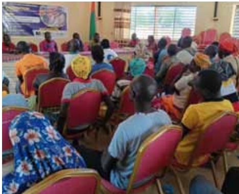
Les membres de ASDE donnent une communication sur « Leadership et organisation de la vie des Coopérative au village.

identifie les coopératives des hommes et celles des femmes regroupées dans le clan du Consortium COPRUDE . Pour renforcer les capacités opérationnelles, une séance de formation de deux (02) jours a été organisée à la faveur des Techniciens et techniciennes de proximité. Cette formation a officiellement lieu le 24 au 25 Novembre 2023 à la mairie de Kindi. Au total, dix (10) villages (Gounda, Soum-Gogo, Louangea, Villy Yalgtega, Toèga, Nazouanga, Kindi, Dakaye, Lallé Yactenga et Yili) d'hommes et femmes ont bénéficié de cette formation dénommée « Formation de Techniciens et Techniciennes de Proximité ». Cette formation a été assurée par les membres bénévoles de l'association ASDE. D'autres sessions de formations au profit des coopératives sont été dipensées le 16 et 17 Février 2024 prochain.