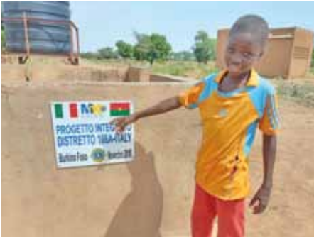
Projet Intégré=école, eau, travail, santé–Parrain: les Lions Clubs du District 108 A Italie.

d'Italie, le district 403A3 du Burkina Faso, les associations MK Onlus Italie. Le jardin maraîcher de deux (02) hectares est cependant alimenté d'eau de forage et permet à la population de disposer en son sein d'eau potable et de produire des différentes sortes de spéculations avec le système d'irrigation en place. On distingue la coopérative des hommes et femme. La production devrait à terme permettre d'accroître les revenus des membres dudit village. Ces travaux de production s'exécutent sous la coordination et le soutien des membres de l'association ASDE qui entre dans le cadre de l'exécution du programme «le développement de l'Afrique par l'Afrique» qui est sa composante dans le domaine scolaire.