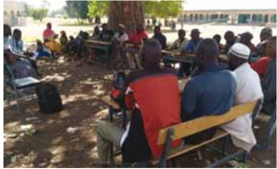
L'assemblea della cooperativa del villaggio di Gounda.

LE COOPERATIVE = completata la formazione e la costituzione di 22 cooperative di cui 11 di soli uomini ed 11 di sole donne per lo sviluppo della produzione di ortaggi. In totale sono 660 soci, ossia 660 famiglie che stanno imparando un nuovo modo di lavorare insieme