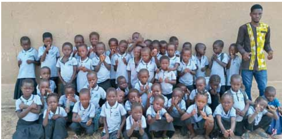
Une vue des enfants dotés de kits scolaires.