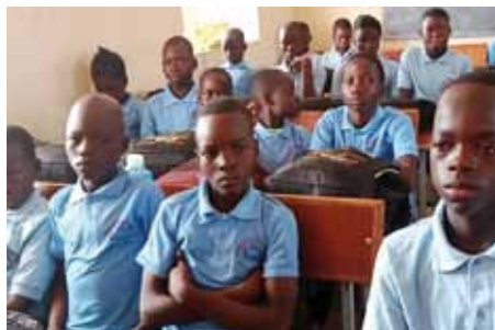
Scuola di secondo livello.