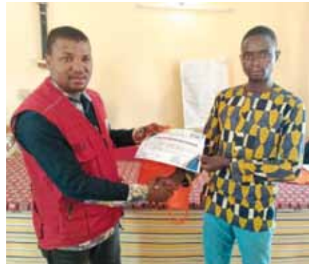
Une vue de remise de l'attestation à un participant.