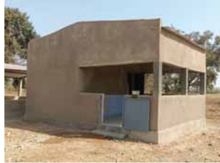
Une vue de la Cuisine.