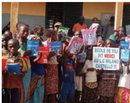
Bambini nel villaggio di Yili.