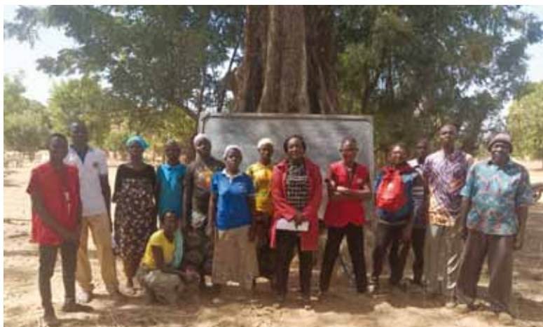
Corso di formazione a Kindi per la costituzione del Consorzio fra le cooperative di villaggio.

Il sabato 17 febbraio 2024 presso il Centro Abbé Pierre di Koudougou si sono riuniti i Presidenti delle Cooperative rurali e, con l'organizzazione e la preparazione culturale realizzata dai giovani del Gruppo ASDE, hanno proceduto ad una giornata di analisi sui valori della cooperazione e sulle possibilità operative di un Consorzio che possa organizzare acquisti e vendite. Nella tarda serata, dopo la presentazione professionale di tutti i partecipanti, è stato eletto il 1° Consiglio di Amministrazione del Consorzio che è composto da 6 uomini e 6 donne distribuiti nei ruoli di Presidenza, Segreteria, Tesoreria, Comunicazione, Produzione, Lavorazione, Vendita.