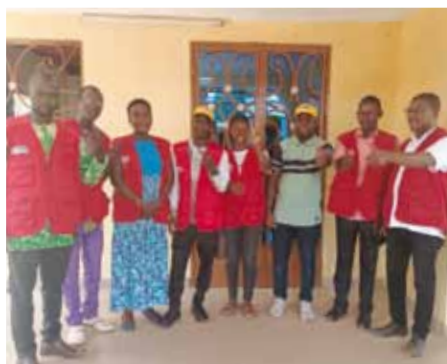
I giovani di ASDE attivi nel servizio di assistenza tecnica e formazione professionale.

È nata ASDE (Actions Solidaires et Développement Endogène) = riconoscimento legale dell'Associazione per l'attività di "Servizi formativi e gestionali" ed attivazione di un costante programma operativo. Nove giovani Burkinabè laureati e pronti a diffondere nei villaggi e nelle scuole la cultura dello "SVILUPPO DELL'AFRICA CON L'AFRICA".