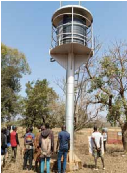
Le château d'eau de 5 mètres permet d'arroser facilement tout le potager.