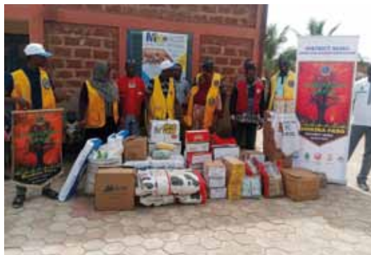
Dotation de vivres à l'orphelinat Home Kisito .

En chaque mois de décembre, de nombreux orphelinats du Burkina Faso bénéficient de la compagnie des lions italiens de MK onlus et ceux du Burkina ainsi ASDE.