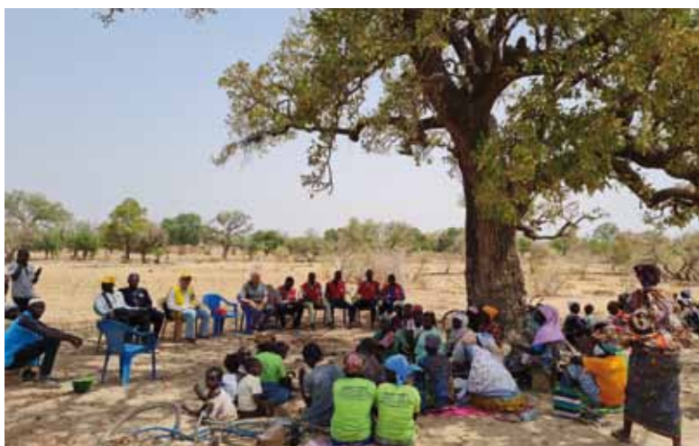
L'assemblea a Lounga con i tecnici agricoli di ASDE e con i delegati di MK Onlus Italia.