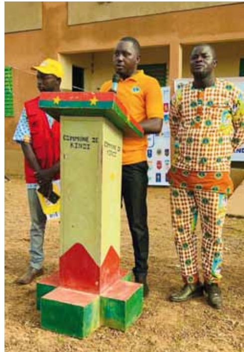
Discours du président de Lions Club KDG BAOBAB Lors de la remise officielle des kits scolaires à Kindi.

Le projet « 100% à l'école » est un progrès constant d'année en année. De l'école de Soum-Gogo à l'école de Villy en passant par l'école de kindi, plus de deux mille (2000) élèves qui sont pris en charge à travers la dotation des kits scolaires en 2023. La somme mobilisée pour les achats des kits scolaires 2023 s'élève à huit (08) millions de FCFA . Ces dons ont permis aux élèves de poursuivre les cours avec sérénité. Ces kits sont entre autres les tissus, des tee- shirt, des sacs, des cahiers, des bics, crayons, gommes, des lampes solaires. Il faut retenir que la cérémonie officielle de la remise a été à Kindi et a connu la présence des Lions du Burkina. Ce projet est invité à s'étendre dans les années à venir au Burkina Faso.