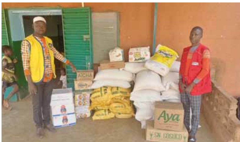
Dotation de vivres à l'orphelinat de Anadji.

de santé de promotion sociale (CSPS) de Shalom de Guiloungou et Sacré cœur de Boussé et de Centre Médical Saint Maximilien Kolbe de Sabou ont reçu des sommes d'argent en chèque pour leur permettre de subvenir à leurs besoins quotidiens. Cette dotation permet à la prise en charge de ces centres notamment au plan alimentaire et contribue à la célébration de la fête de Noël des enfants dans la gaieté. L'ensemble de ses dons s'élève à plus de cinq (05) millions de FCFA dont sept (07) orphelinats et quatre (04) CREN . Nous comptons au total 11.