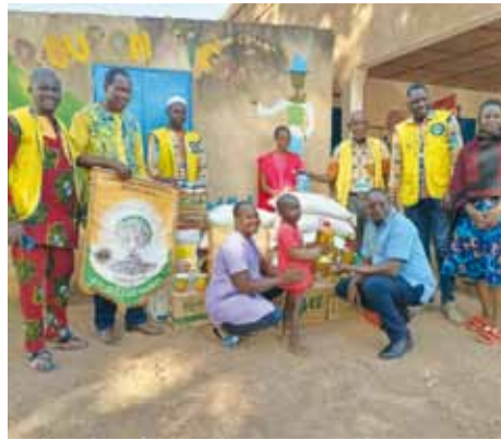
Consegna viveri a Reo.