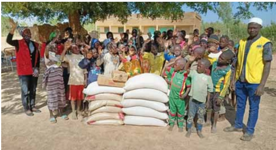
Viveri a le Saint Innocents di Guiloungou.