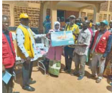
Consegna materiale sanitario a Yili.